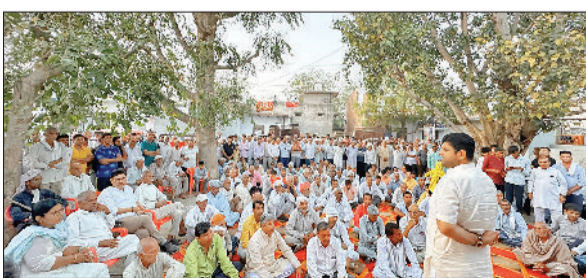
मंडी अटेली। ग्रामीण जनसभा को संबोधित करते प्रदेश के पूर्व उपमुख्यमंत्री दुष्यंत चौटाला।

यह लोकसभा चुनाव हम सबके के लिए अग्नि परीक्षा है और यही चुनाव आने वाले विधानसभा चुनावों की नींव भी रखेगा। इसलिए राव बहादुर सिंह के पिछले चुनाव में जो कमी रह गई थी, उसकी भरपाई इस चुनाव में करने का काम करें और सभी कार्यकर्ता तन-मन से समर्पित होकर इनकी जीत के लिए कार्य करें और इन्हें सबसे अधिक मतों से जीताकर लोकसभा में भेजें। उक्त आह्वान प्रदेश के पूर्व उपमुख्यमंत्री दुष्यंत चौटाला ने देर शाम को