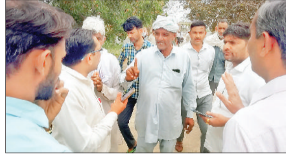
नारनौल। मंडी में बहस करते किसान एवं खरीद अधिकारी तथा पुलिस की मौजूदगी में सरसों खरीदते अधिकारी।

गौर हो कि आजकल अनाज मंडियों में सरकारी समर्थन मूल्य 5650 रुपये प्रति क्विंटल की दर से सरसों की सरकारी खरीद की जा रही है। इस खरीद के लिए सरकार ने कुछ मानदंड तय किए हुए हैं, जिनमें से एक मानदंड सरसों में 8 प्रतिशत से अधिक नमी नहीं होना भी है। नारनौल मंडी में हेफेड नैफेड के लिए कोआप्रेटिव सोसायटी के माध्यम से सरसों की खरीद कर रही है। इसी के चलते सोमवार को मंडी में टीनशेड के नीचे सरसों खरीद करने के लिए पहुंचे और मशीन के जरिए सरसों की नमी मापने लगे। जिन किसानों की सरसों में नमी निर्धारित आठ प्रतिशत से ज्यादा मिली, उस सरसों को अधिकारियों ने रिजेक्ट करते हुए उसे खरीदने से इंकार कर दिया और अमली देरी के